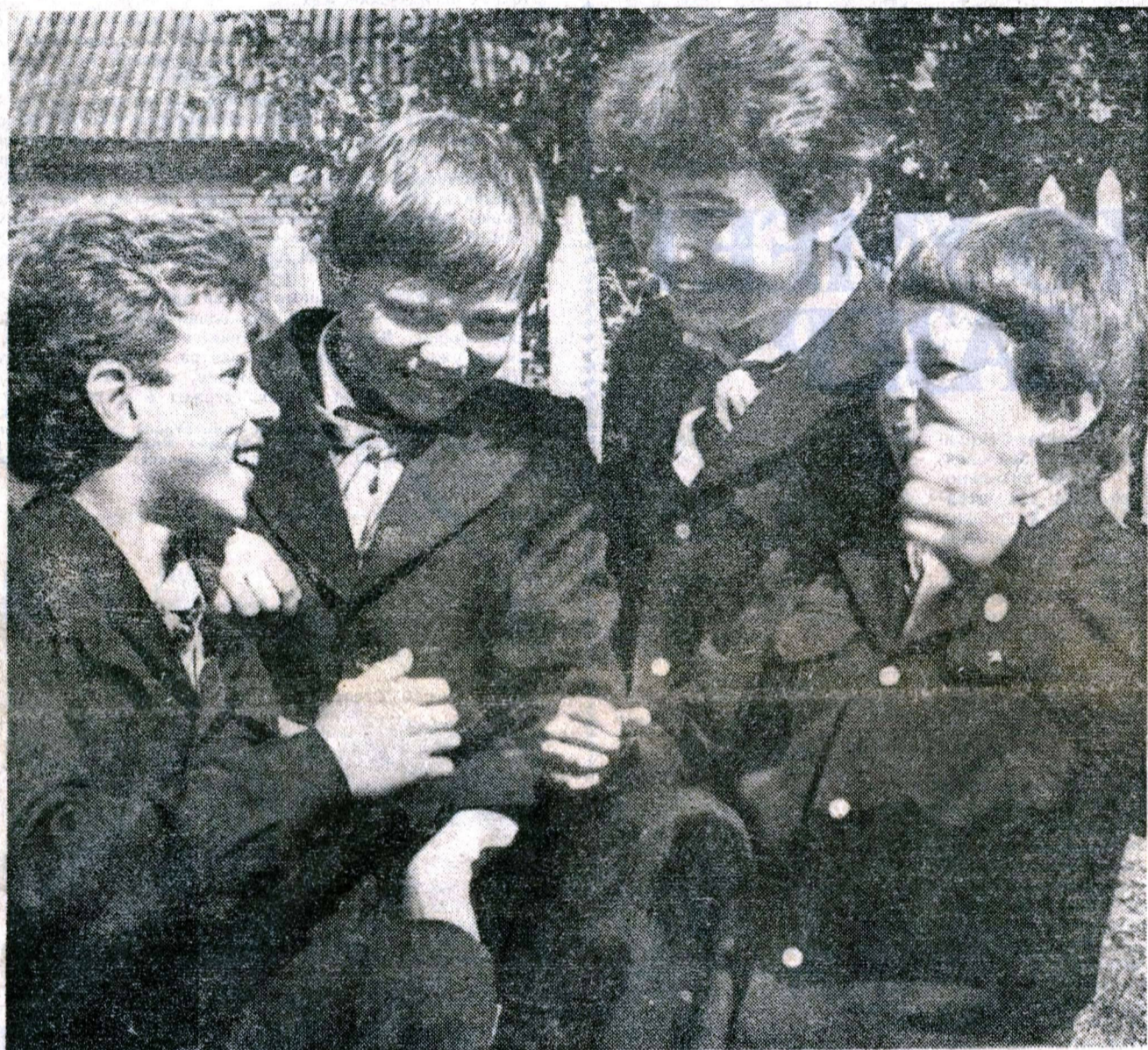
Ребята из отряда 7-го «Б» петушинской средней школы № 1 Владимирской области провели разведку пионерских дел. В новом учебном году в зоне их пионерского действия — молочная ферма совхоза «Клязьминский». А мальчишки из 7-го «Б» узнали, что их помощники ждут в соседнем лесхозе.

В. ЖИТОМИРСКИЙ, редактор отдела информации политического еженедельника «Новое время».